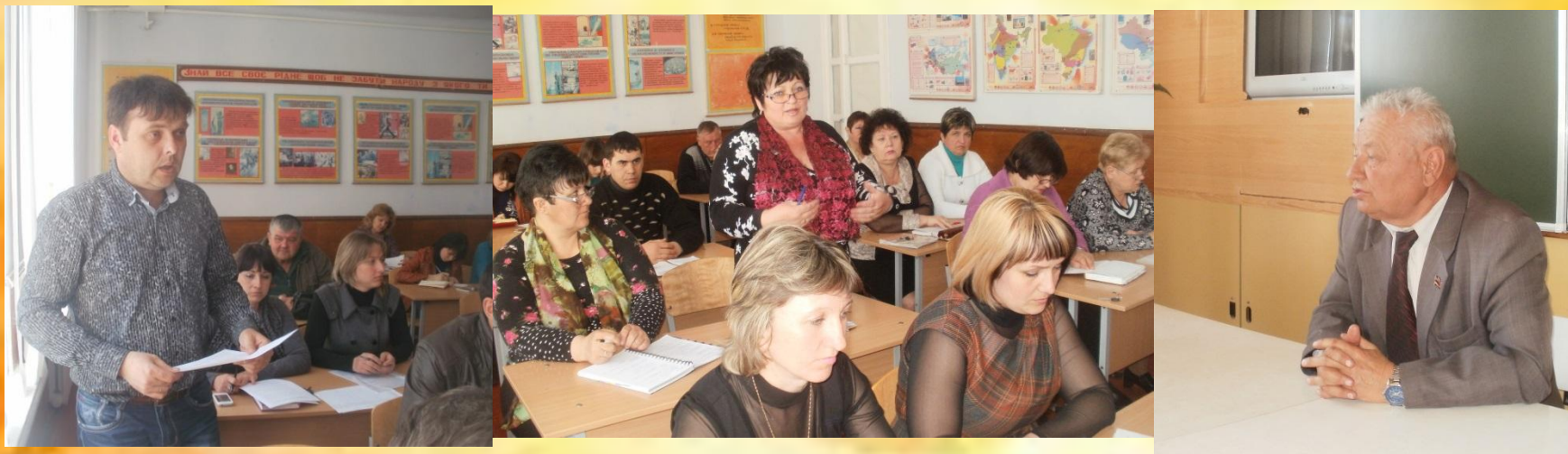
Засідання методичної ради