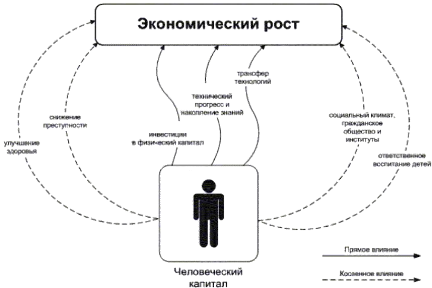
Рисунок 1. Каналы влияния человеческого капитала на экономический рост.