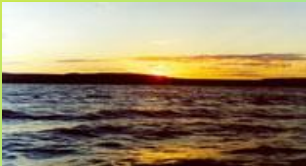
Закат на озере Таймыр

Крупнейшее озеро – Таймыр, к заповеднику относятся его заливы – бухта Ледяная, Байкуранеру, Байкуратурку. Другие значительные озёра – Сырутатурку, Надатурку, Дюдассаматурку