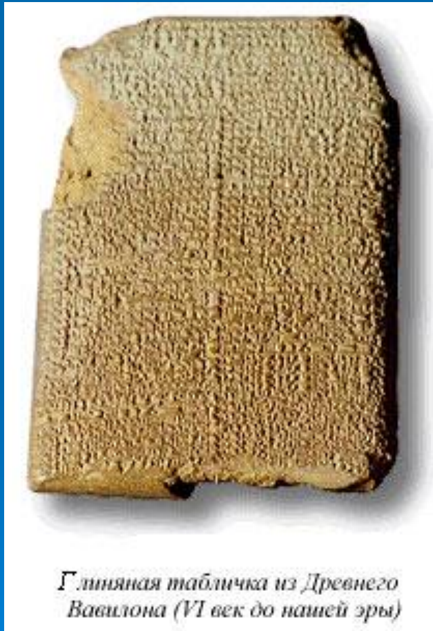
Глиняная табличка из Древнего Вавилона (VI век до нашей эры)

Прогрессии как частные виды последовательностей встречаются в древних египетских папирусах и в клинописных табличках вавилонян.