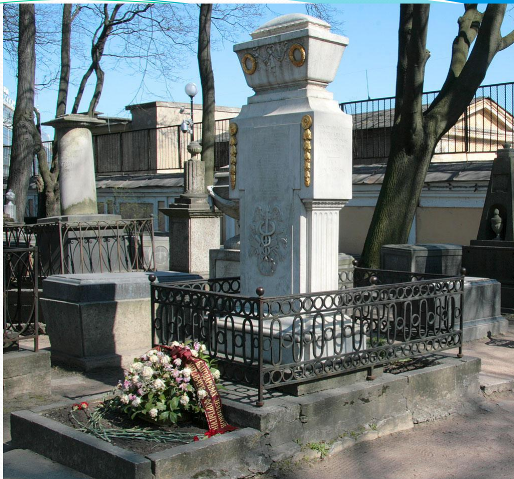
Михаил Васильевич Ломоносов похоронен на Лазаревском кладбище около Александро-Невской лавры.