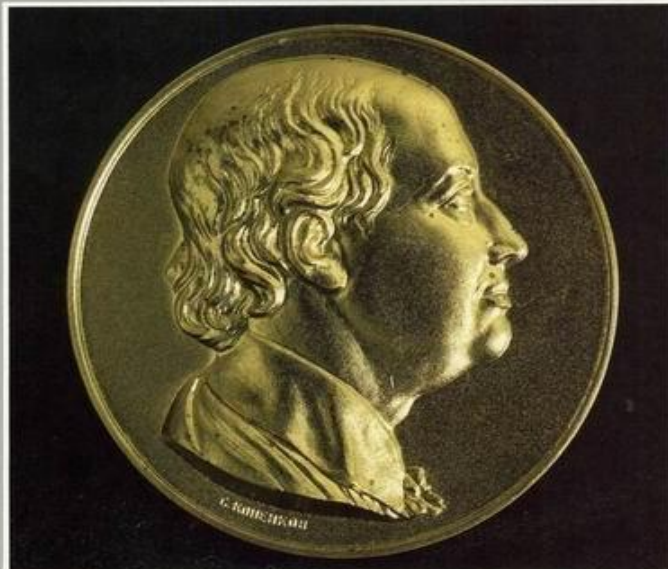
Медаль им. М.В.Ломоносова Академии наук СССР