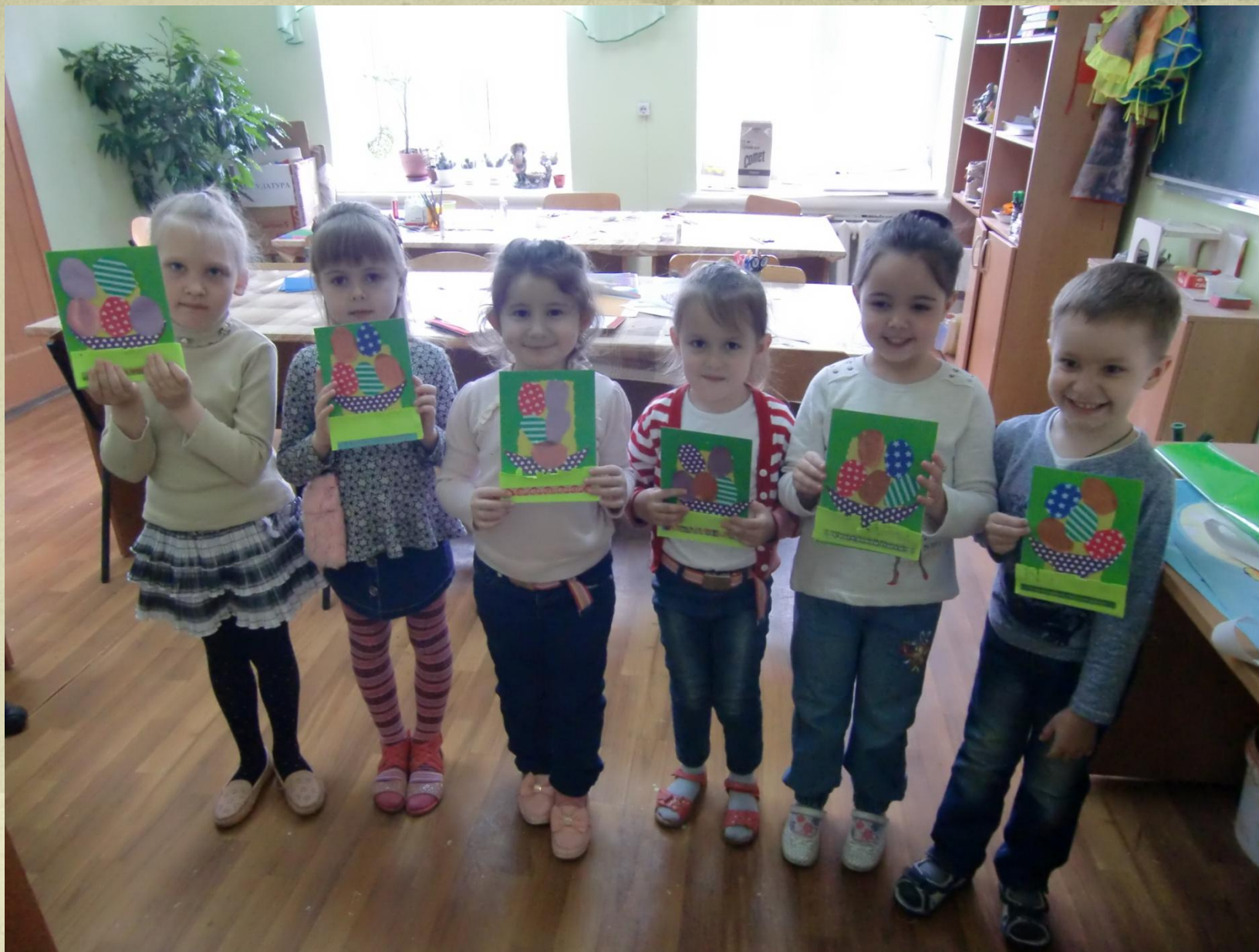
3 группа, возраст 6-7 лет