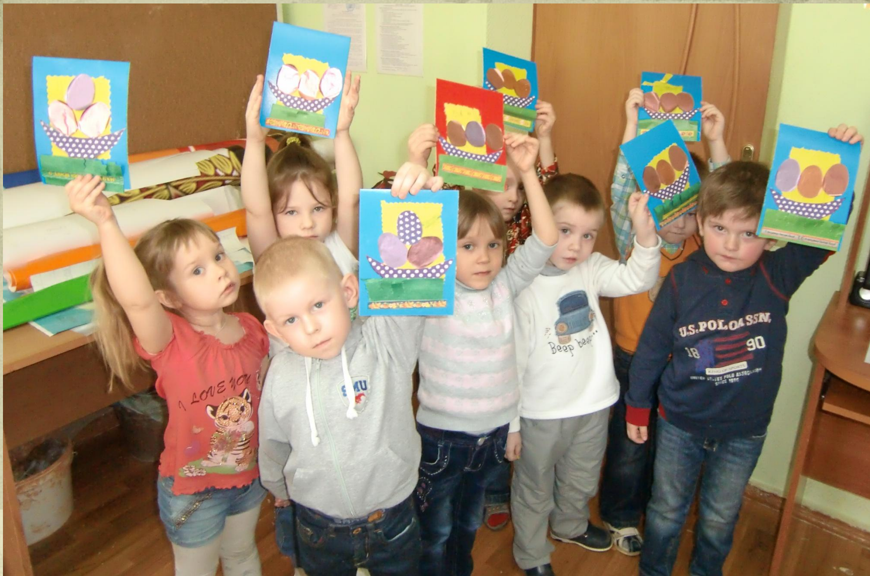
1 группа, возраст 4- 5 лет