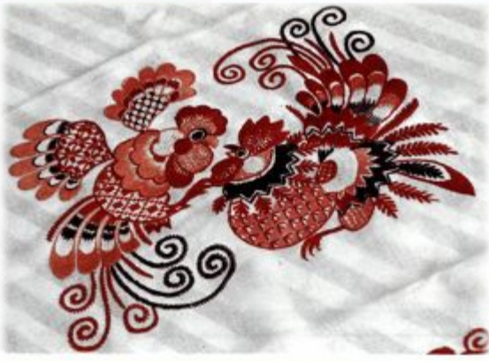
1307146 — Вологодский музей-славянской вышивки. Фрагмент вышивки «Горький петух» (Владимирский собор).