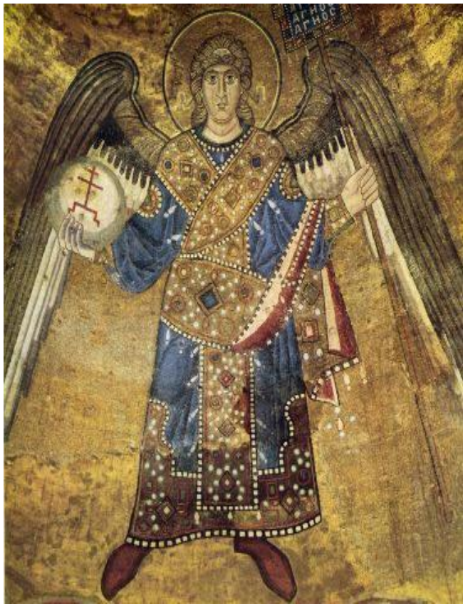
Архангел Киев, Святая София, XI век

МОЗАИКА – рисунок или узор из скрепленных между собой разноцветных камешков, кусочков стекла.