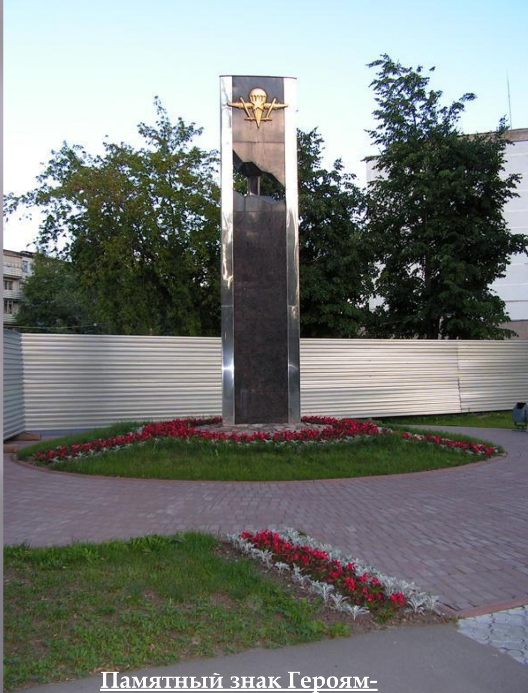
Памятный знак Героям-