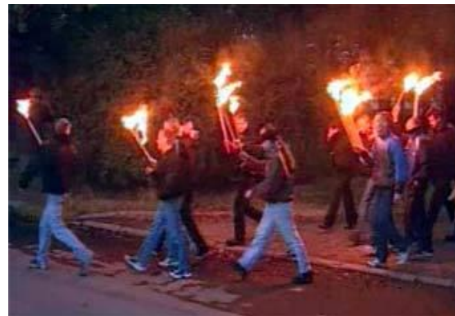
Скинхеды. Факельное шествие в Петербурге.