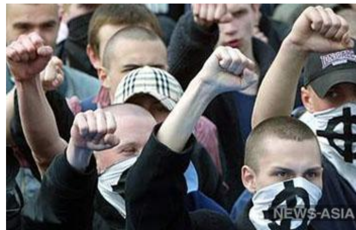
В Костроме скинхеды напали на неформалов