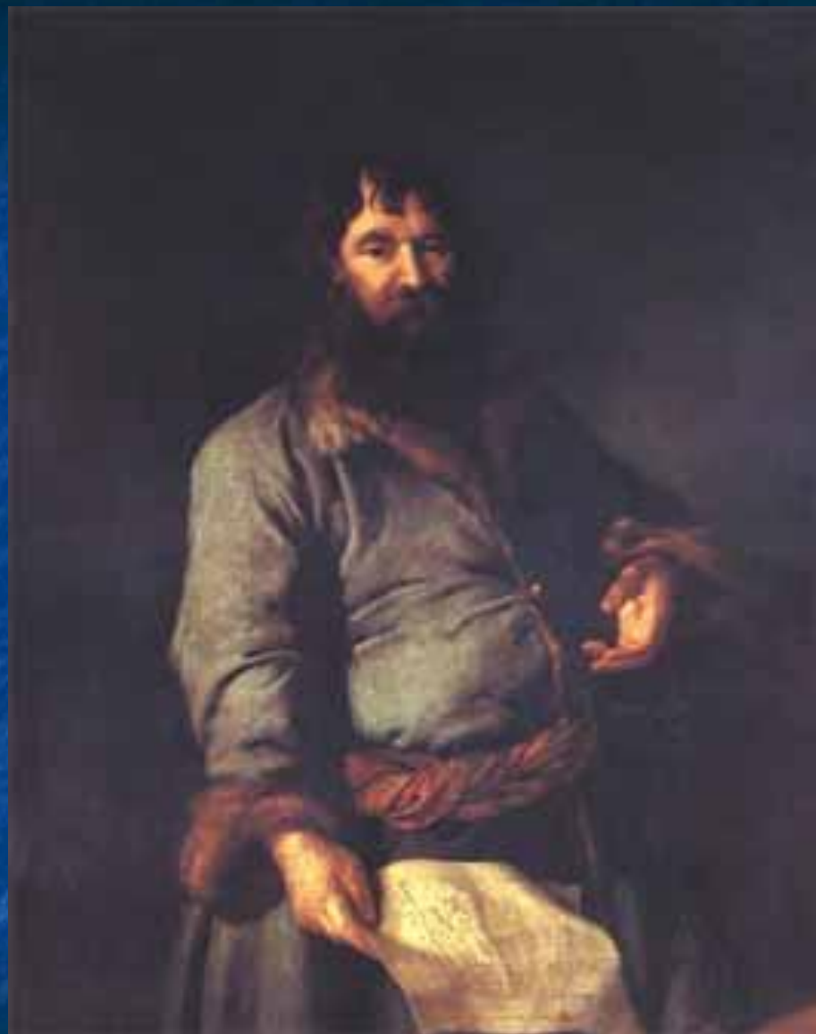
"Портрет Н.А.Сеземова" (1770), Левицкий