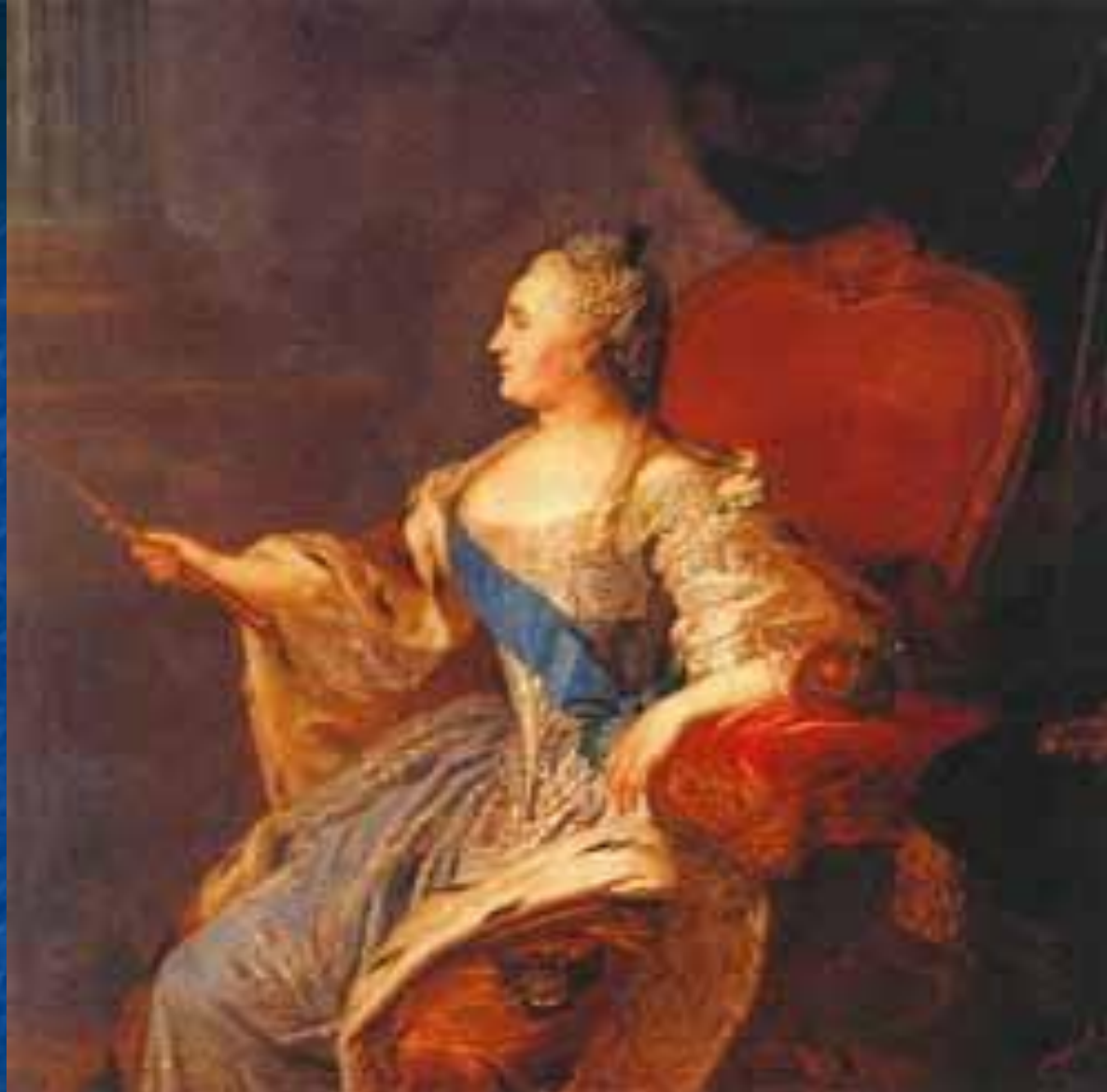
Рокотов. Екатерина II. «писан» в 1763 году, месяц май 20 дня.