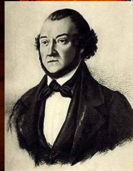
М. П. Мусоргский