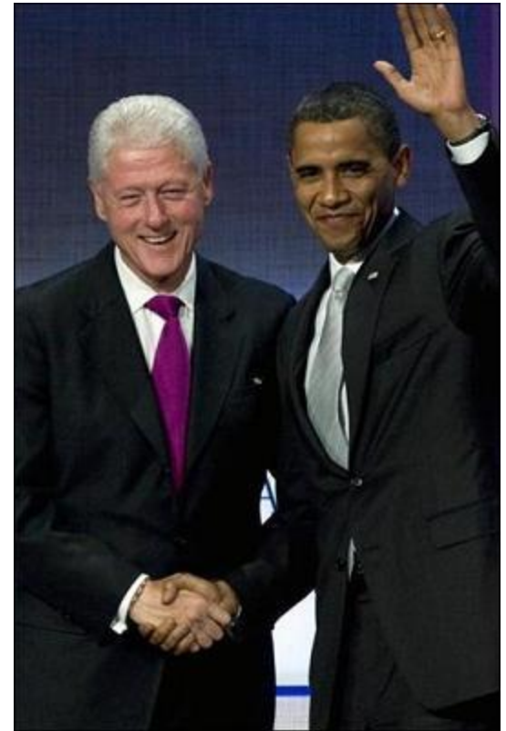
22 сентября 2009 года. Нью-Йорк. Экс-президент США Билл Клинтон и действующий президент Барак Обама на 5-ой ежегодной встрече "Clinton Global Initiative"