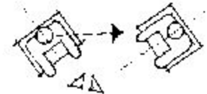
Рис. 143. Открытая треугольная диспозиция.