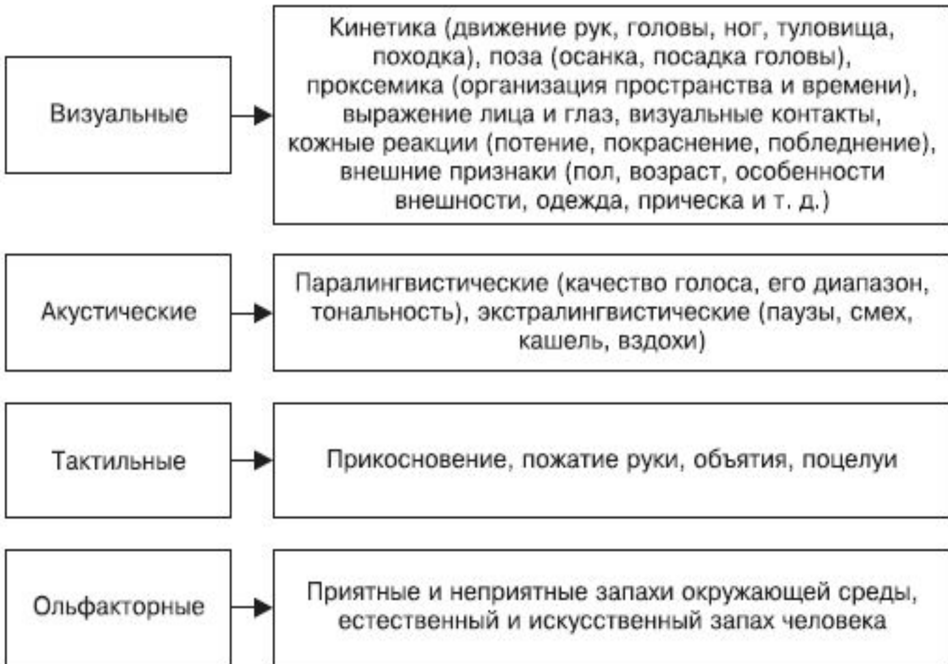
Рис. 3.3. Виды невербальных средств общения