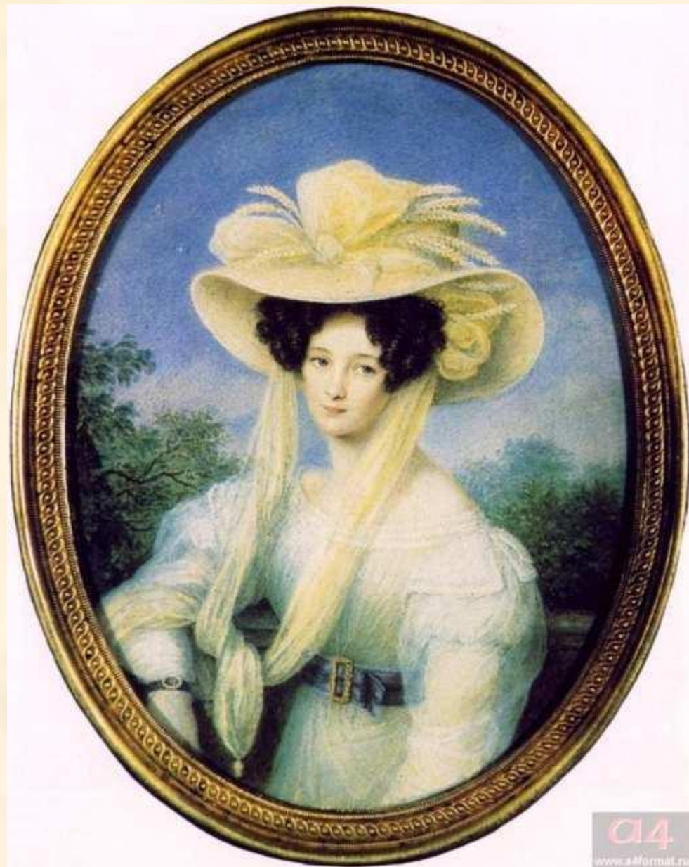
Элеонора Ботмер, первая жена Ф.И. Тютчева. Миниатюра И. Щелера. 1830-е

1826 год – Тютчев женится на графине Ботмер. Их семью посещает вся баварская интеллигенция. Тютчев переводит на русский язык стихотворение Гейне «С чужой стороны». Перевод произведения назывался «Сосны» и годом позже был напечатан в «Аонидах». Известно также, что Федор Иванович спорил с