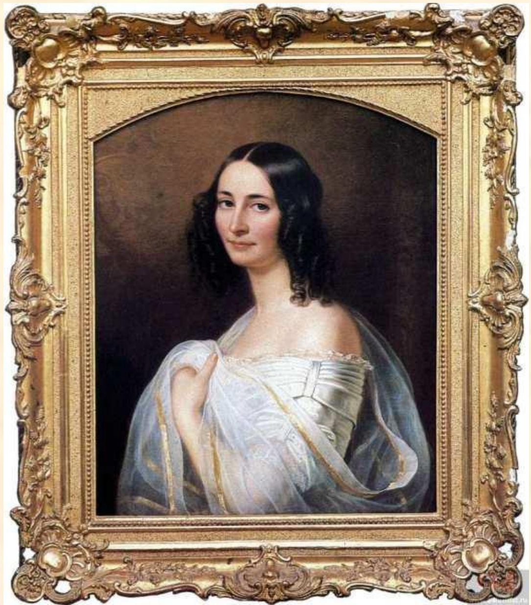
Эрнестина Пфеффель, вторая жена поэта. Художник Ф. Дюрк. Начало 1840-х

1839 год – Тютчев женится на баронессе Дернгейм. В этом же году за самовольный отъезд в Швейцарию (чтобы заключить брак) он отставлен со службы и лишен звания камергера. Тютчев с женой переезжают в Мюнхен.