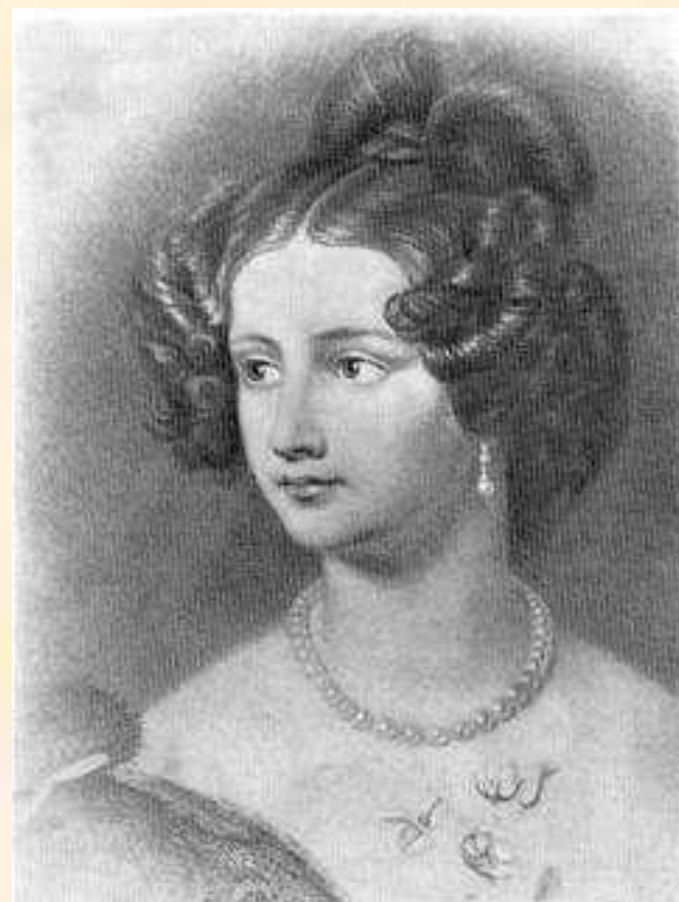
Амалия Крюденер. Фотография с портрета маслом работы художника И.Штилера. 1838 г.

Таков горе - духов блаженный свет; Лишь в небесах сияет он, небесный; В ночи греха, на дне ужасной бездны, Сей чистый огонь, как пламень адский, жжет.