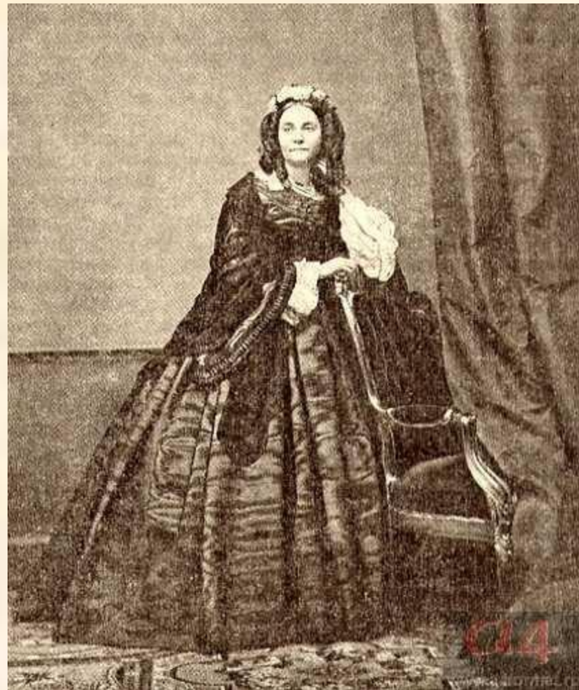
Эрнестина Федоровна Тютчева. Петербург. Фото 1862

Не знаю я, коснется ль благодать Моей души болезненно- греховной, Удастся ль ей воскреснуть и восстать, Пройдет ли обморок духовный? Но если бы душа могла Здесь, на земле, найти успокоенье, Мне благодатью ты б была — Ты, ты, мое земное провиденье.