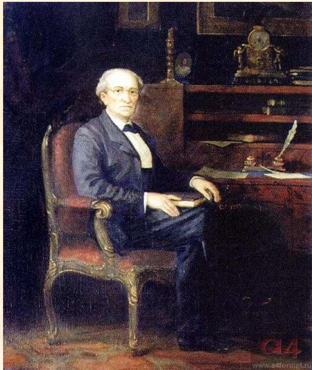
Ф.И. Тютчев. Художник М. Решетнев