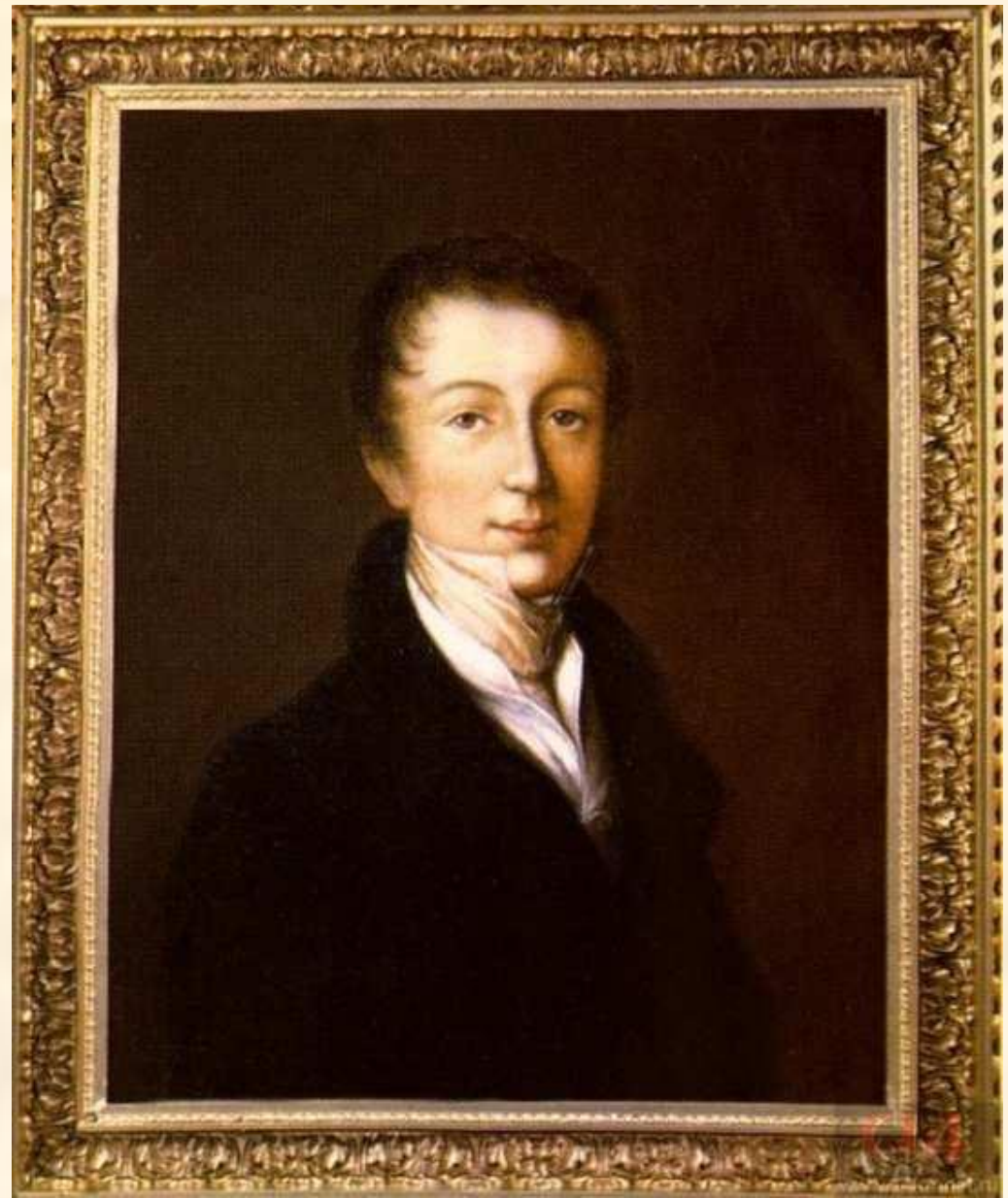
Ф.И. Тютчев. Неизвестный художник. 1819–1820

И ты с веселостью беспечной Счастливым провожала день; И сладко жизни быстротечной Над нами пролетала тень.