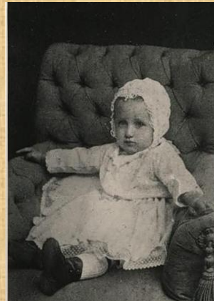
А. Ахматова в детстве