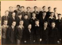
34 Circle of Boris Y. G. (Comrades)