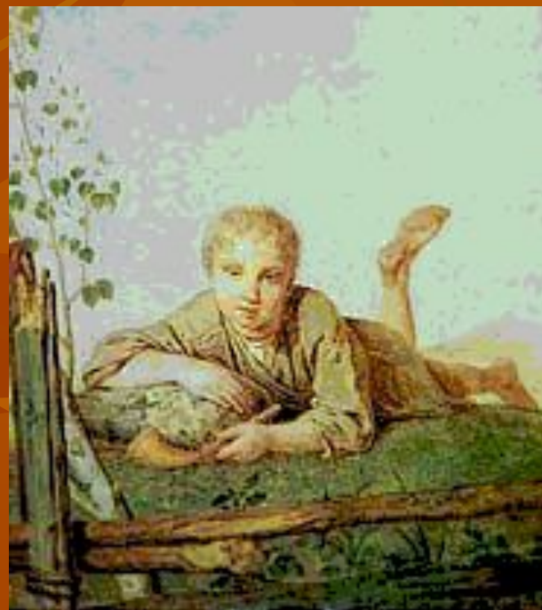
А. Г. Венецианов. «Пастушок с дудкой». 1820-е годы.