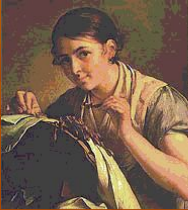
В. А. Тропинин. «Кружевница». 1823 год. Третьяковская галерея.