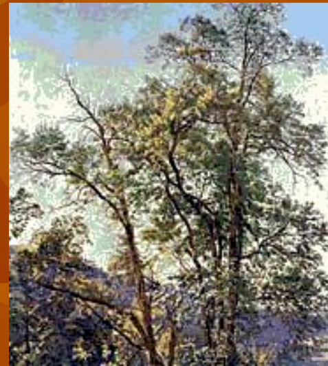
Александр Иванов. Олива. Третьяковская галерея в Москве.