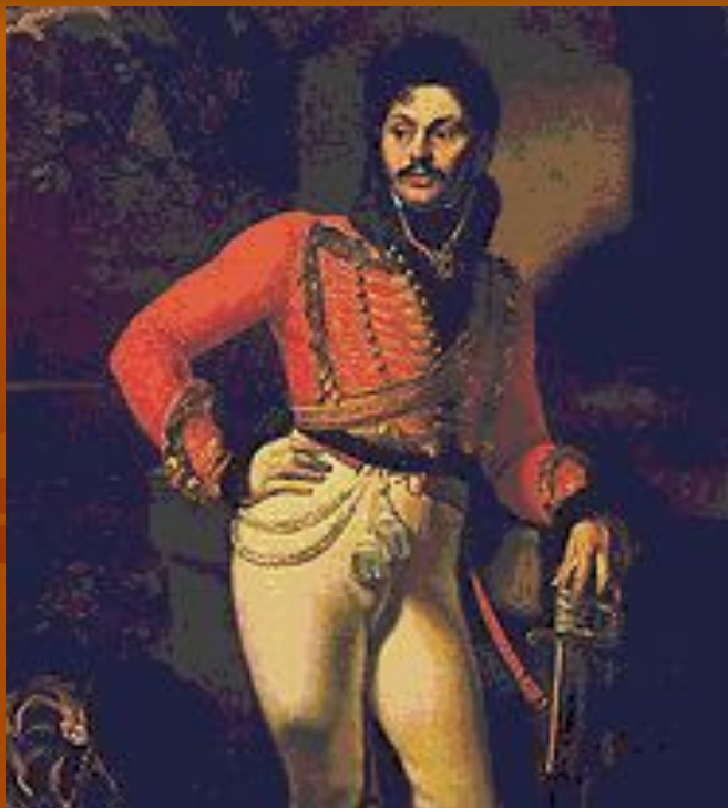
О. А. Кипренский. «Портрет лейб-гусарского полковника Евграфа Давыдова». 1809.