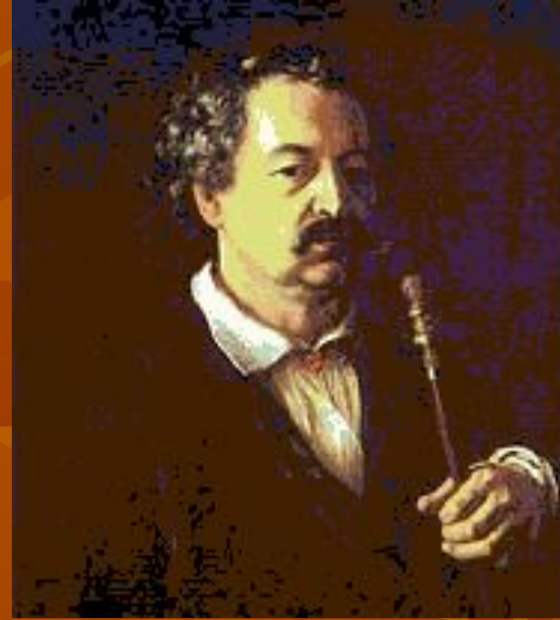
В. А. Тропинин. «Портрет неизвестного в халате с трубкой».