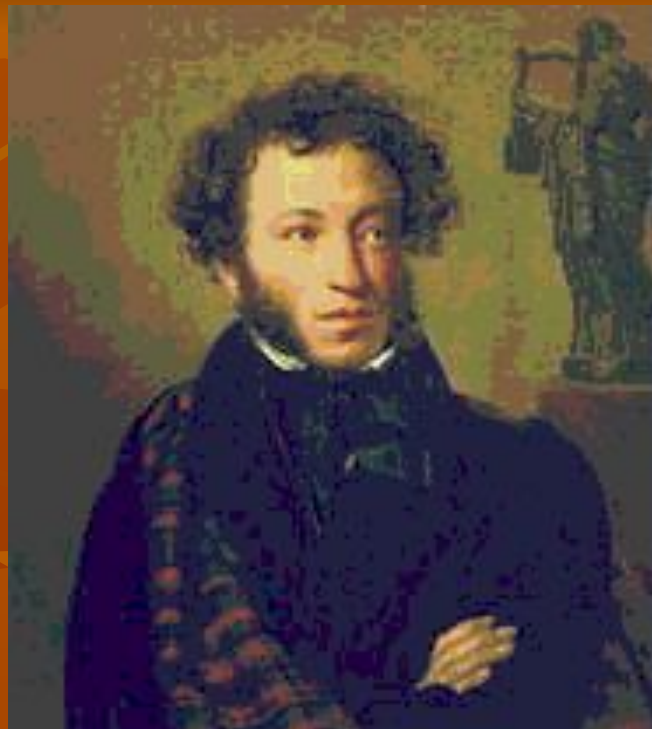
А. С. Пушкин. Портрет работы О. А. Кипренского (1827, Третьяковская галерея).