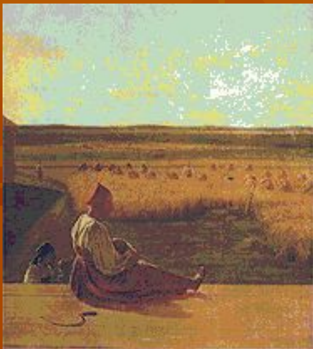
А. Г. Венецианов. «На жатве. Лето». Середина 1820-х гг.