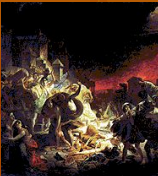
К. П. Брюллов. «Последний день Помпеи».