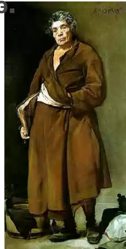
Картина Диего Веласкеса