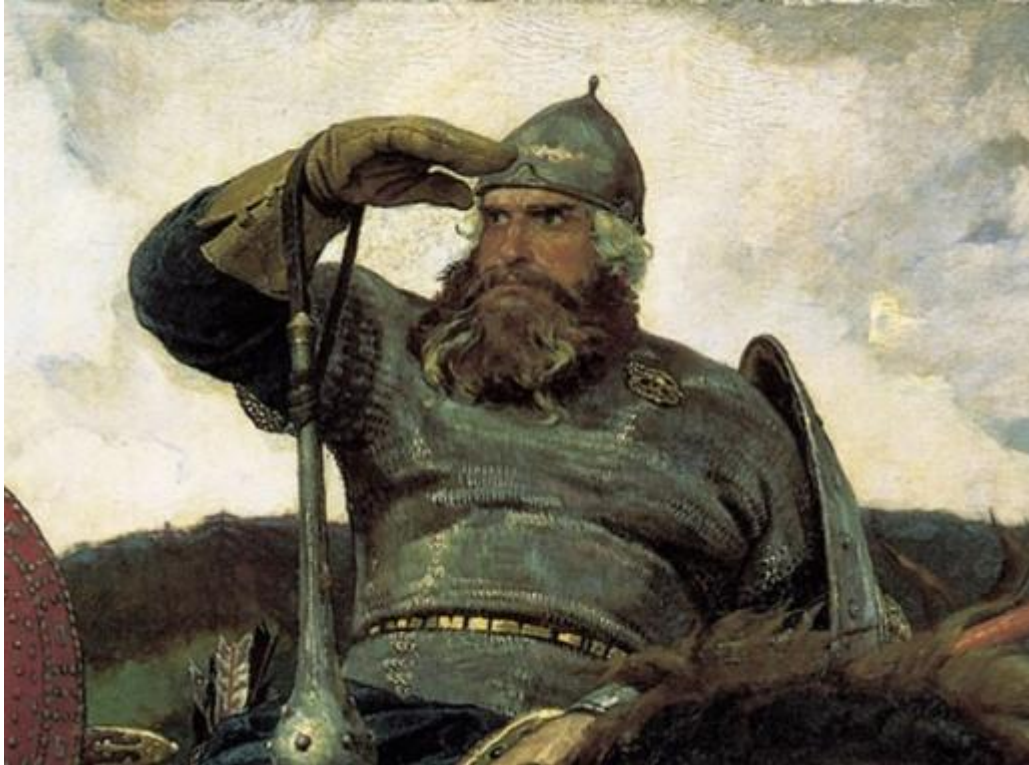
В. Васнецов. Илья Муромец . (Фрагмент картины «Богатыри»)