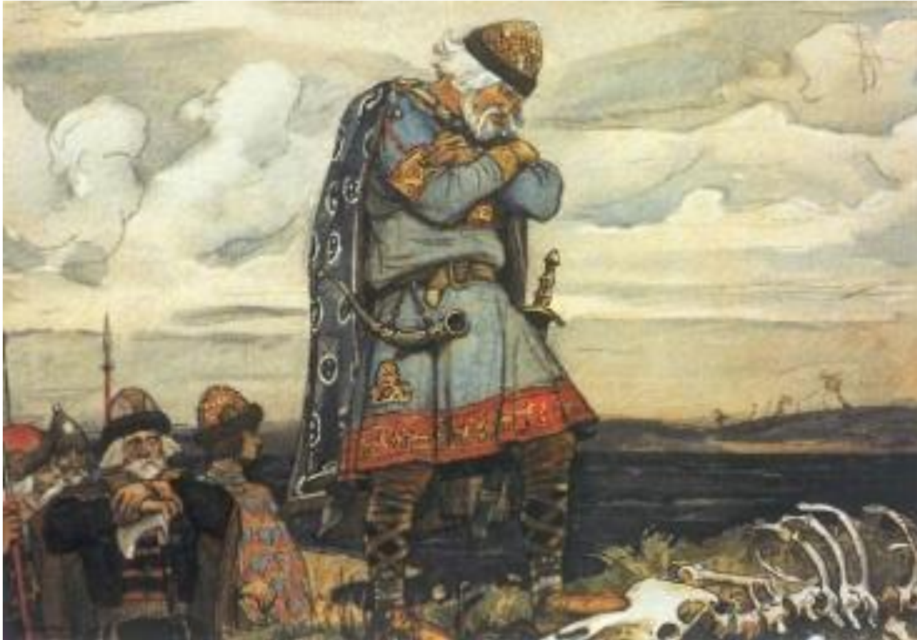
В. В. Васнецов. Олег у костей коня Иллюстрация к "Песни о вещем Олеге" А.С.Пушкина 1899г,акварель, Государственный Литературный музей, Москва