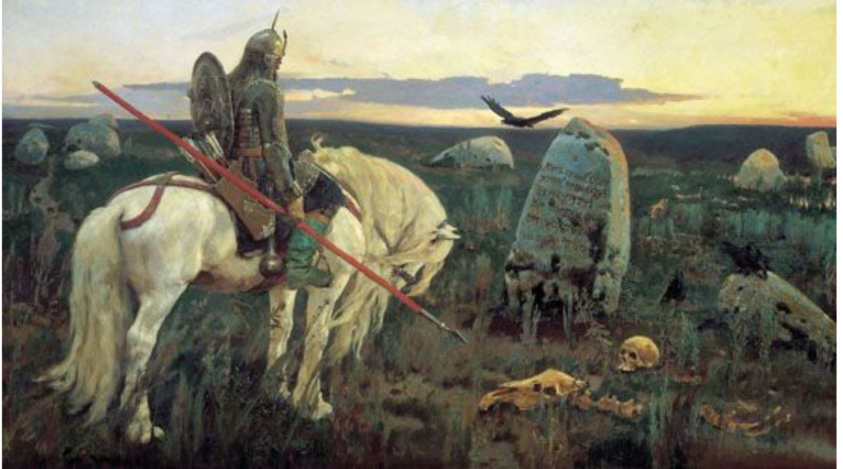
В. Васнецов. Витязь на распутье Холст, масло. 1882 г. Москва, Россия. Государственная Третьяковская галерея