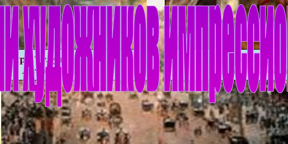
Камиль Писсаро Площадь Театра Франсез