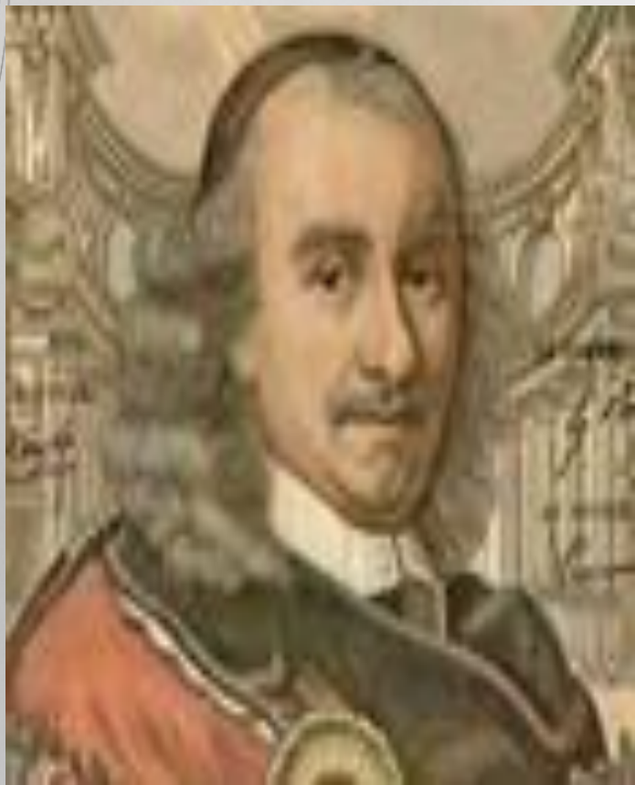
Пьер Корнель 1606 - 1684 г.- французский драматург.