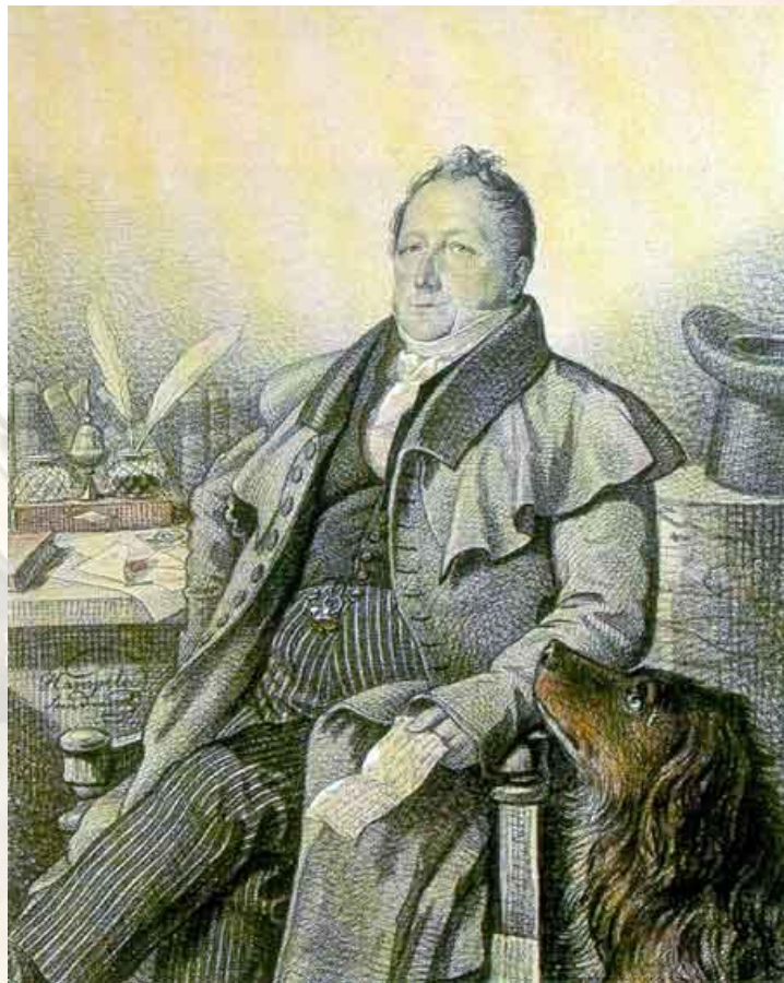
С.А. Пушкин. 1824.

Отец, Сергей Львович, небогатый помещик, человек образованный, хорошо знал литературу, был знаком со многими русскими писателями и сам немного писал.