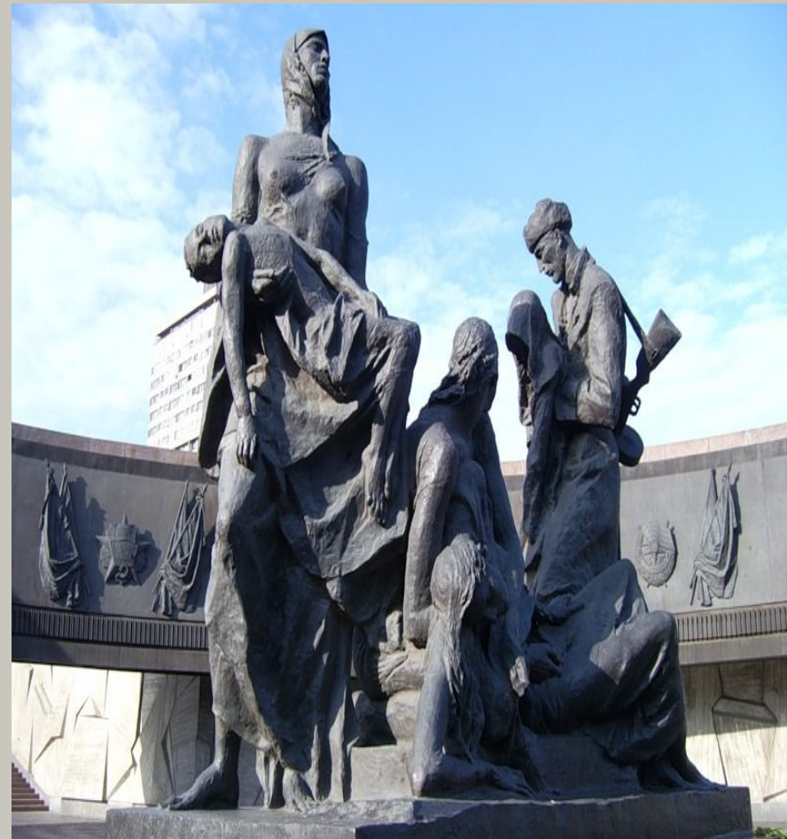
Памятник героическим защитникам блокадного Ленинграда.