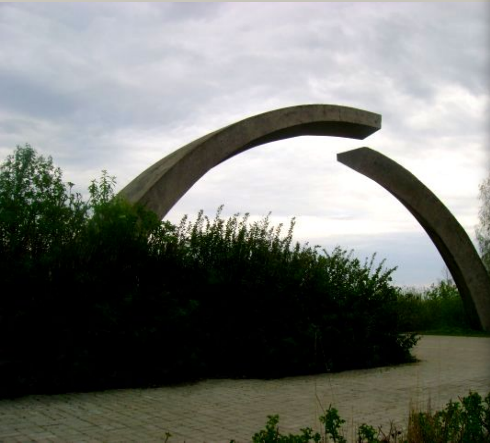
Памятник в честь разрыва блокады Ленинграда!