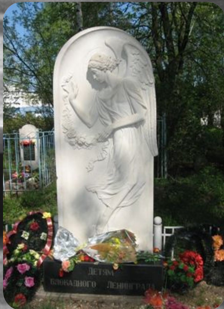
Памятник детям блокадного Ленинграда (Ярославль).