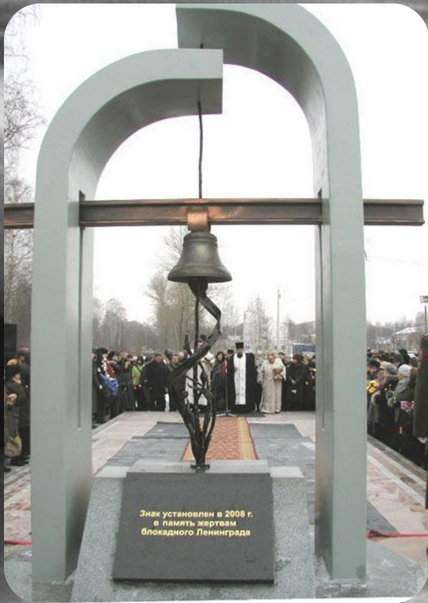
В Ярославле памятник жертвам блокадного Ленинграда.