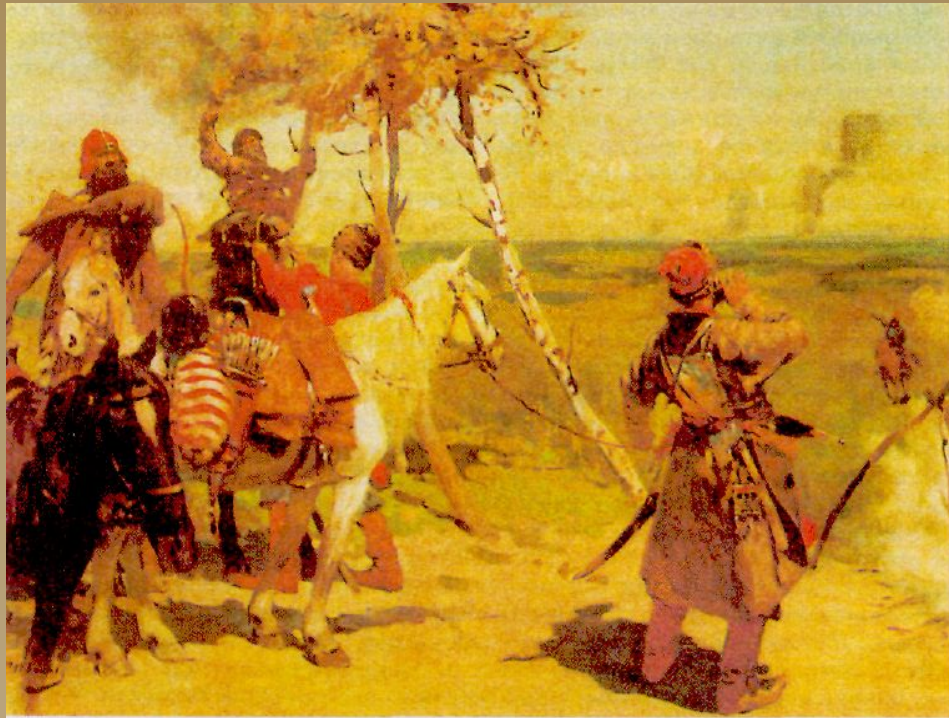
«На сторожевой границе Московского государства». Картина С. Иванова

1581 г. выдался крайне неблагоприятным для Русского государства: