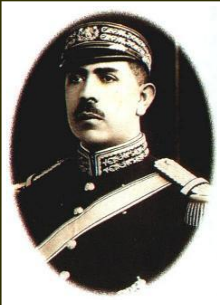
Ласаро Карденас Президент Мексики

В Великобритании 2-ы к власти приходили лейбористы, но преодолеть трудности они не смогли и в сер. 30-х гг. к власти возвратились консерваторы.