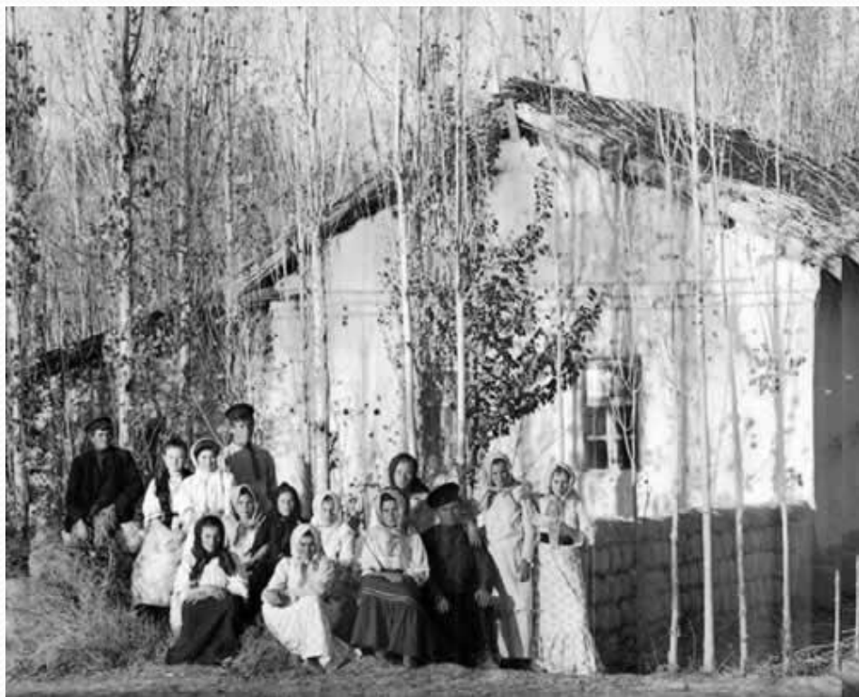
Русские переселенцы в Самаркандской губернии Туркестанского генерал-губернаторства.

● Важнейшим направлением реформы стала переселенческая политика . Борясь с перенаселением в центре страны, Столыпин стал раздавать земли в Сибири на Дальнем Востоке и Средней Азии предоставляя переселенцам льготы (освобождение на 5 лет от налогов и воинской службы). Но местные власти отнеслись к этому враждебно. Почти 20% переселенцев возвратились назад. Правда население восточных районов все же заметно увеличилось.