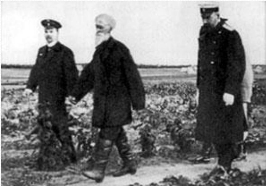
П.А.Столыпин осматривает хуторские огороды близ Москвы в апреле 1910 г