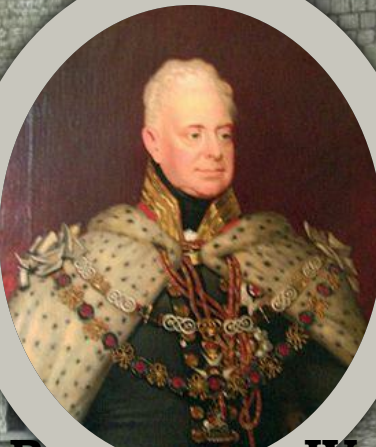
Вильгельм IV William Henry