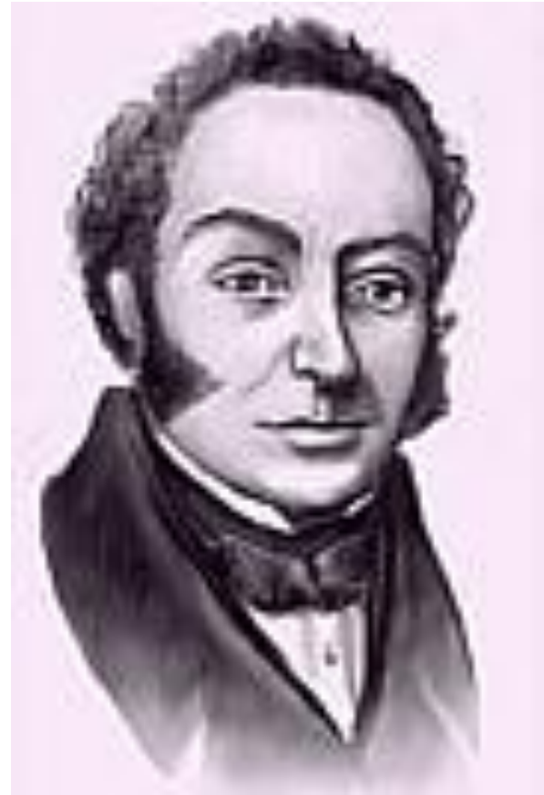
Фергюс О, Коннор (1796-1855)