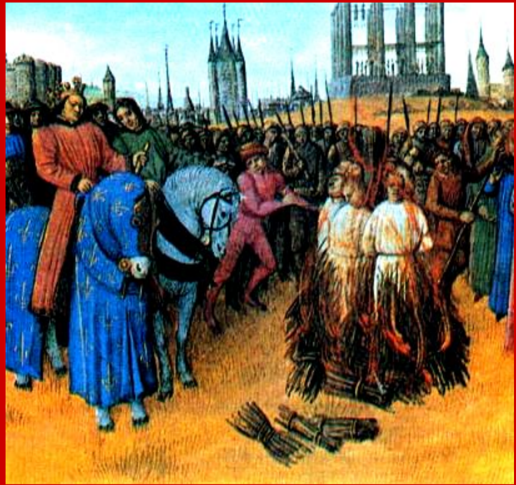
Аутодафе («дело веры») - сожжение еретиков.