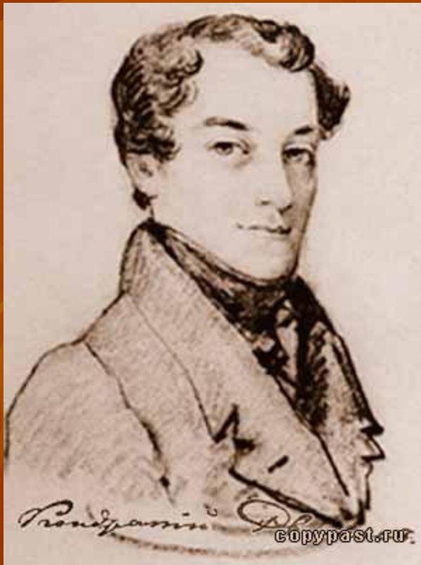
К. Ф. Рылеев