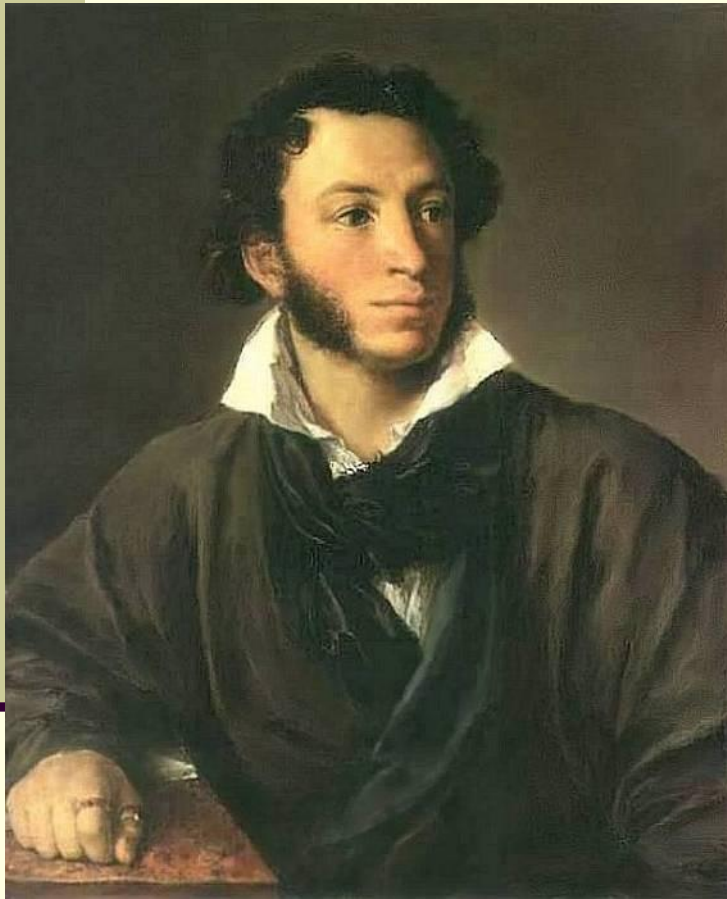
А. С. Пушкин