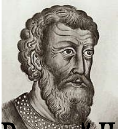
Василий II 1425-1462