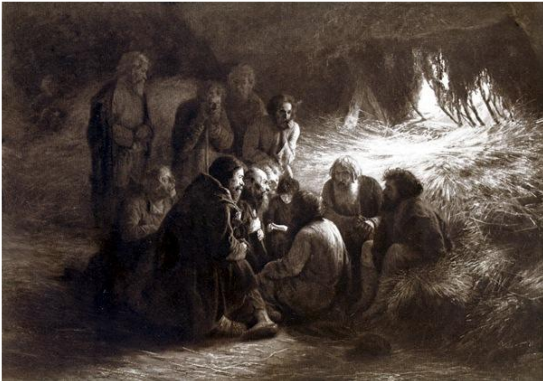
Г.Г. Мясоедов. Чтение манифеста 19 февраля 1861 г.