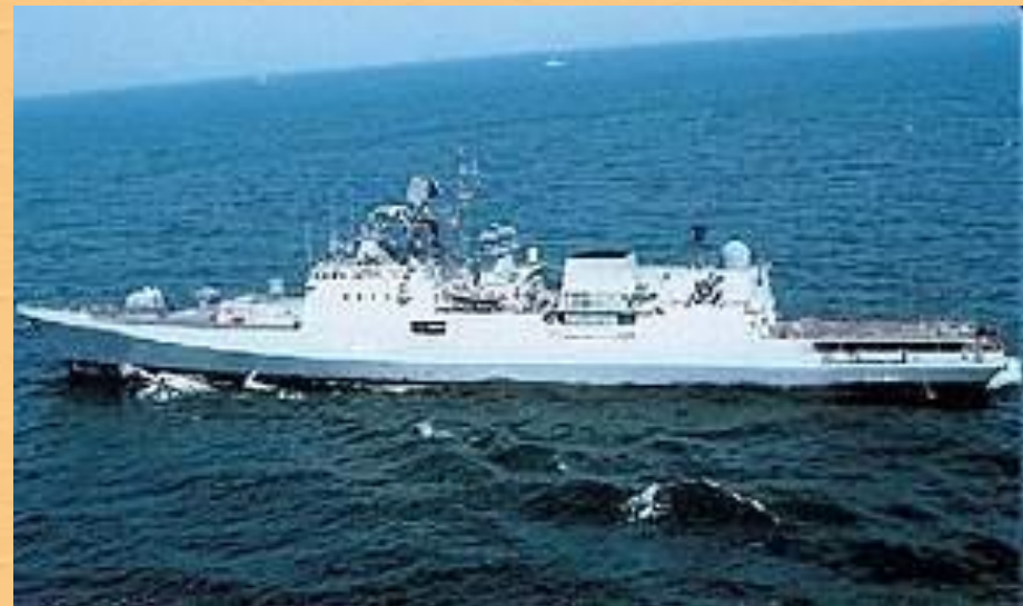
Индийский военный корабль "Табар"