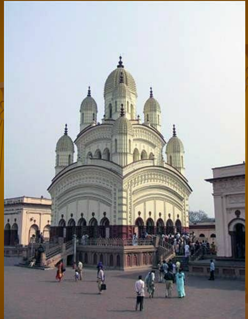
Дакшинешварский храм Кали. Калькутта.