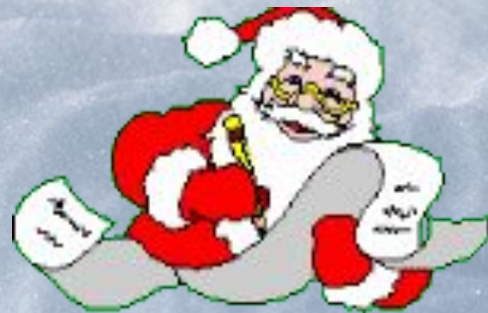
Праздник Дедов Морозов в Олонце Фото 2005 г.