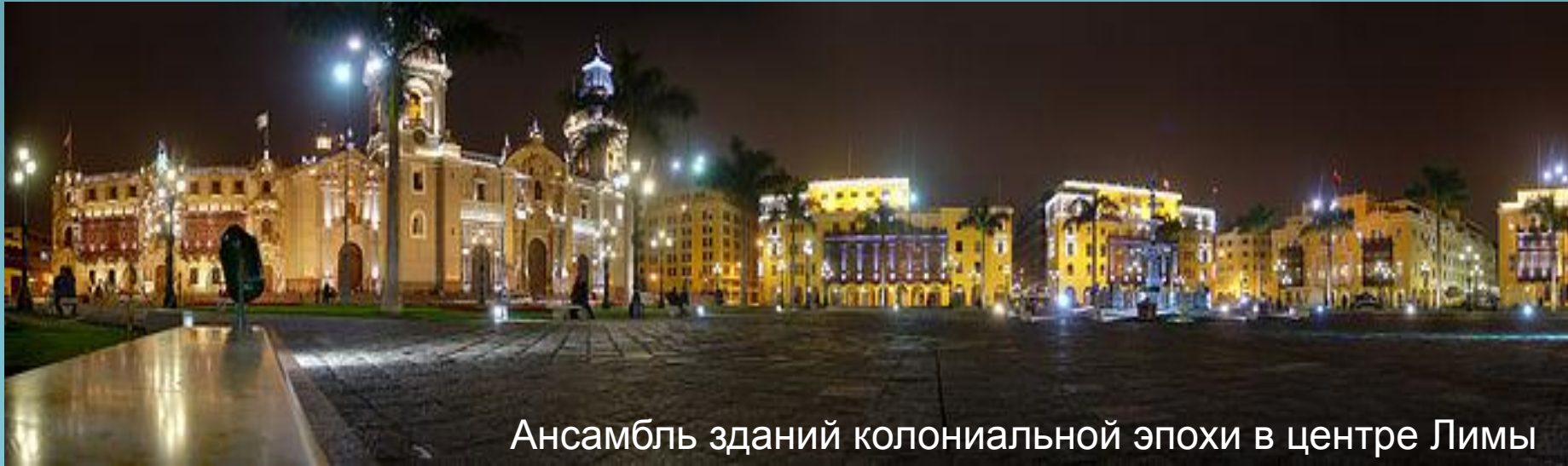
Ансамбль зданий колониальной эпохи в центре Лимы