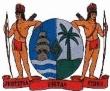
HET WAPEN VAN SURINAME