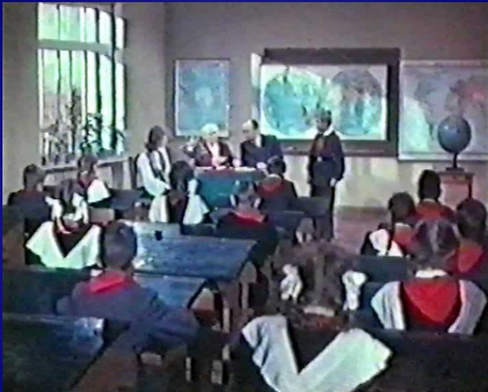
Кадры из кинофильма «Старик Хоттабыч»