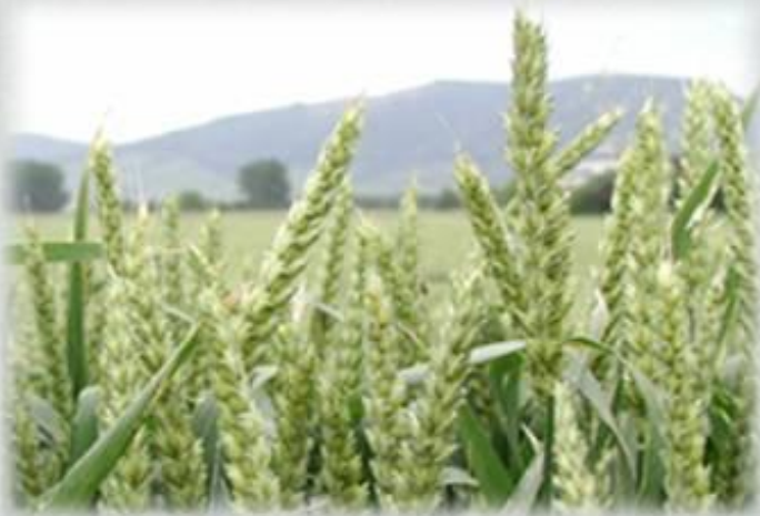
пшеница – самоопыляющееся растение

При создании сортов пшеницы применяют индивидуальный отбор