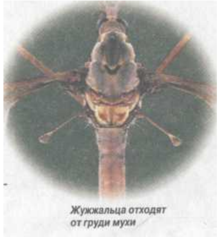
Жужжальца отходят от груди мухи