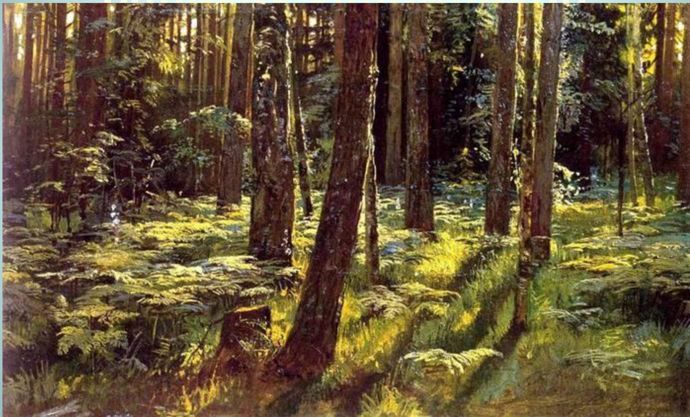
Шишкин И.И. «Папоротники в лесу»