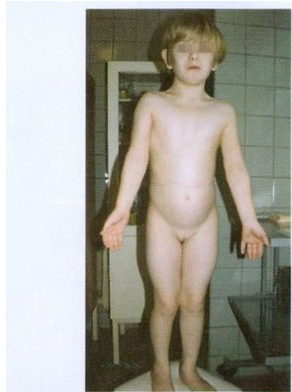
Рисунок 16. Больная 13 лет. Синдром Шерешевского-Тернера. Низкий рост, отсутствие вторичных половых признаков