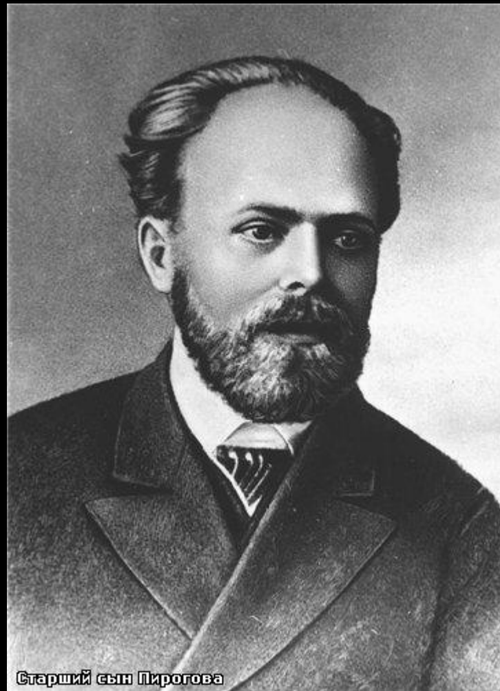
Старший сын Пирогова