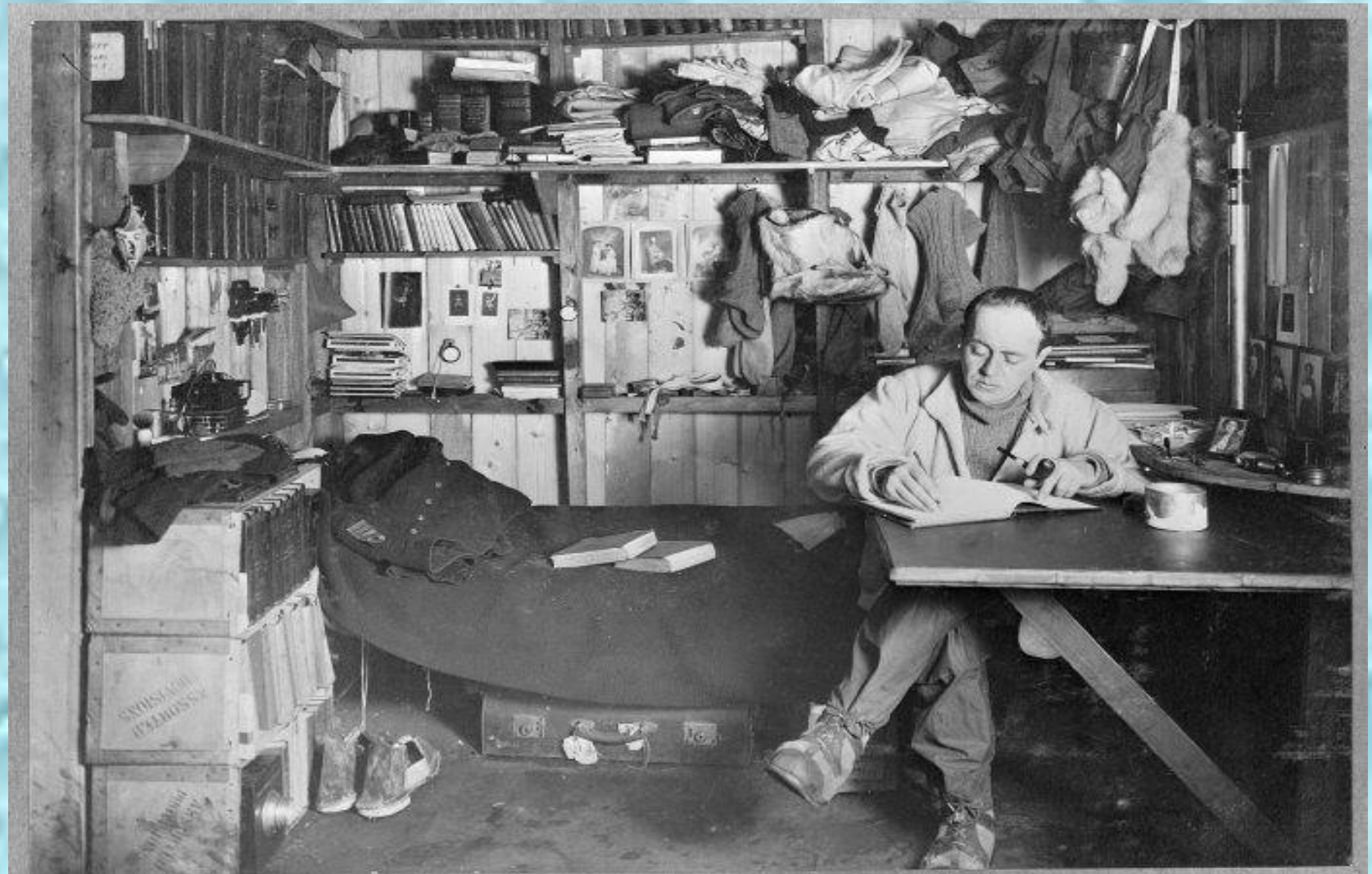
341. Capt. Scott in his den. Oct. 7th 1911.

Роберт Фолкон Скотт - Капитан королевского флота Великобритании, полярный исследователь, один из первооткрывателей Южного полюса