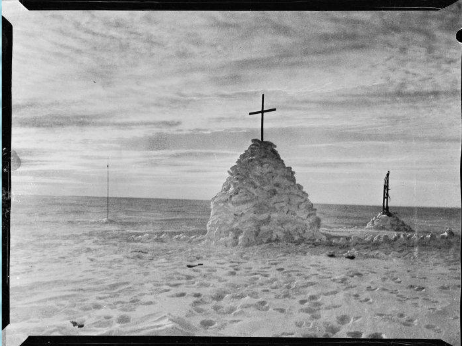
Могила Роберта Скотта, Эдварда Уилсона и Генри Бауэrsa.