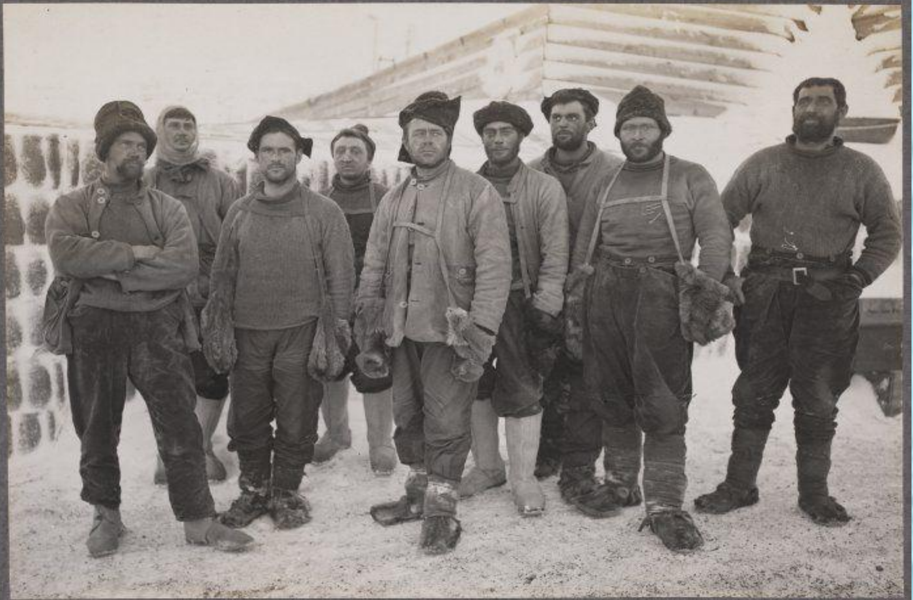
250. Capt. Scott and group taken on return of Southern Party. April 13th 1911.