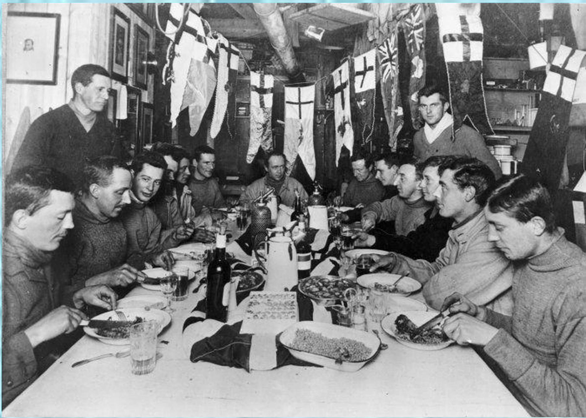
1911. Последний день рождения Роберта Скотта, который отмечался.