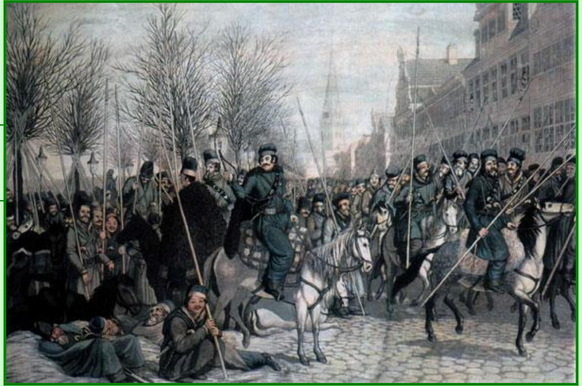
Казачи в Гамбурге

На этот призыв откликнулась Пруссия. Союзная армия достигла 100 000 человек. 4 марта 1813 г. русские войска вошли в Берлин, 19 марта - в Гамбург и создали условия для удара по Франции.