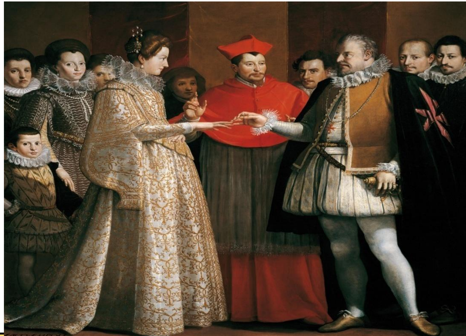
Свадьба Маргариты Валуа и Генриха Бурбона

Чтобы примирить католиков и гугенотов Карл IX решил выдать замуж свою сестру Маргариту за вождя протестантов короля Наваррского Генриха Бурбона. Свадьбу назначили на август 1572 года. Около 20 тыс. гугенотов съехались в Париж. Этим решили воспользоваться вожди католиков во главе с Екатериной Медичи, уничтожив протестантов во главе с адмиралом Колиньи.