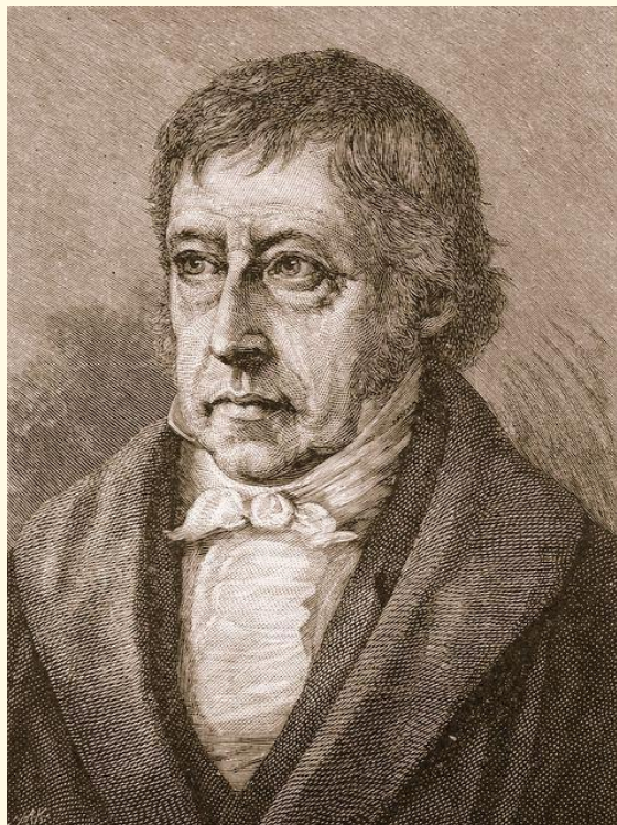
Георг Вильгельм Фридрих ГЕГЕЛЬ (1770 – 1831)