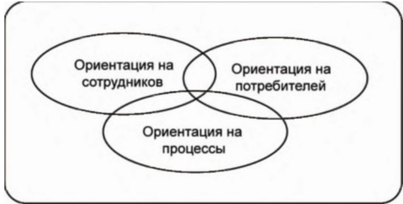
Компоненты процессной стратегии

Ответственность и функции при таком подходе интегрируются в рамках процессов управления и технологических процессов. На смену функционально-ориентированной концепции организации, в которой руководители противопоставлены работникам, а структура — операциям, приходит целостная