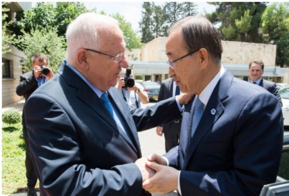
Генеральный секретарь ООН Пан Ги Мун и президент Израиля Реувен Ривлин.

Прямая трансляция: Саммит участников Глобального договора ООН