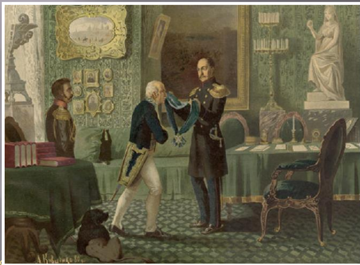
«... за составление свода законов.» Картина А. Кившенко