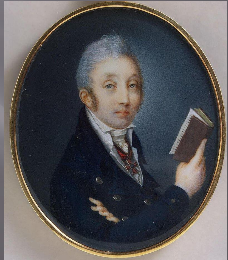
М.М. СПЕРАНСКИЙ В МОЛОДОСТИ