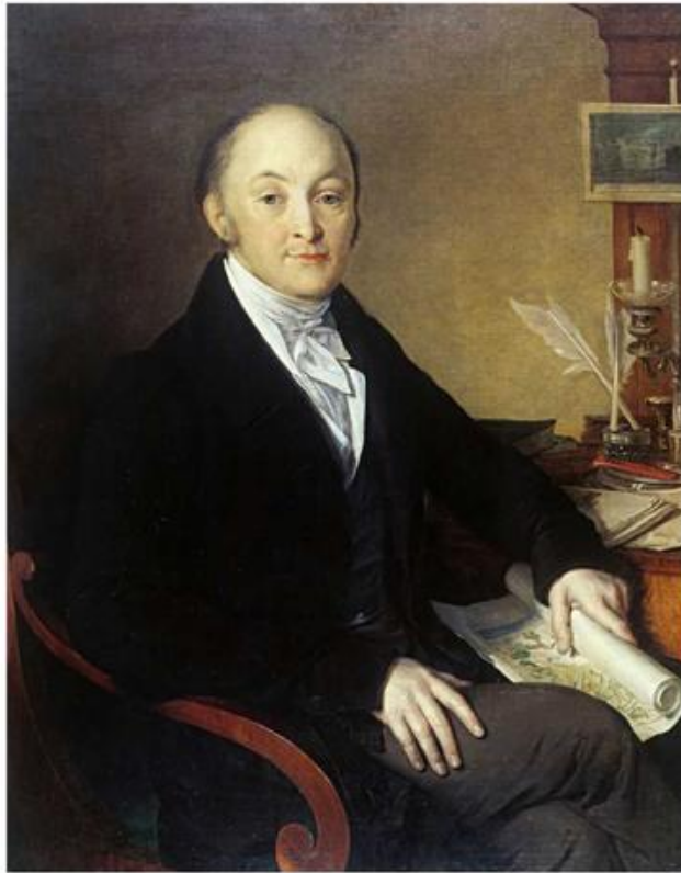
В.А. Тропинин. Портрет М.М. Сперанского. (1839 г.)

«Власть», должно различать от самовластия. Власть (основанная на законах) даёт силу правительству, а самовластие её разрушает, ибо самовластие, даже и тогда, когда оно поступает справедливо, имеет вид притеснения...»