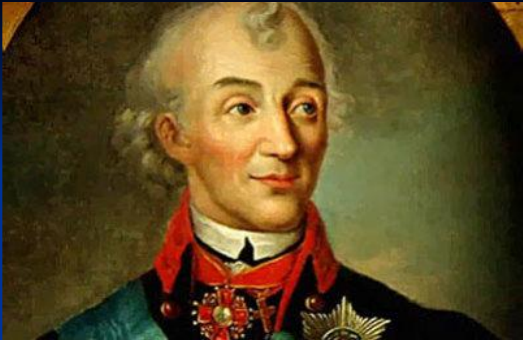
Александр Васильевич Суворов (1730-1800)