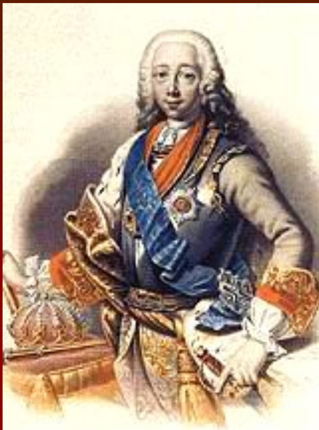
Император Пётр III (супруг Екатерины)