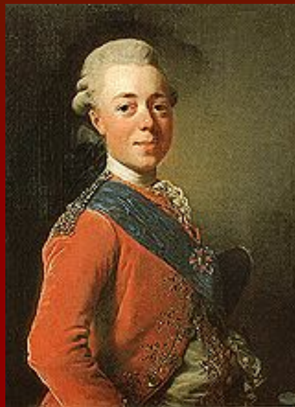
Сын императрицы Павел Петрович