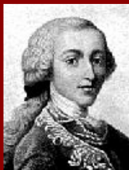
Княжнин Я.Б. Новиков Н.И. Державин Г.Р.